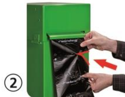
Oben halten, Unten abreißen