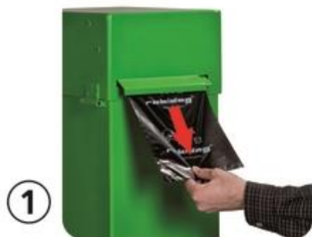
Beutel gerade herausziehen

Die richtige Anwendung des Rollensystems des Robidogs sehen Sie unten.