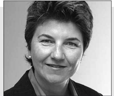
Liebe Mitbürgerinnen und Mitbürger

Am 11. Januar 2008 durften wir den Start in das Alpenstadtjahr 2008 erleben. Eine grosse Anzahl von Veranstaltungen und Projekten wird uns von nun an bis im Dezember 2008 begleiten. Sie sollen Zeugnis ablegen von einer dynamischen Region Oberwallis, die sich nach der Eröffnung der NEAT Lötschberg nach innen und nach aussen den Herausforderungen der Zukunft stellen will. In der vorliegenden Sonderausgabe der Stadtinfo orientieren wir Sie über das Jahresprogramm, die kommenden Anlässe bis April 2008 sowie über die Titelverleihung und die Ziele der Alpenstadt. Ausserdem werben wir für das soeben erschienene Buch der besonderen Art: «Brig-Glis Augenblicke – Seitenblicke – Einblicke», für welches die Stadtgemeinde Brig-Glis als Herausgeberin verantwortlich zeichnet. Die Texte stammen von Luzius Theler, stellvertretender Chefredaktor des Walliser Boten, während Thomas Andenmatten und Renato Jordan mit geübten Fotografen-Augen phantastische Sujets eingefangen haben. Das Resultat der Buchmacher, zu denen auch die Firma Visucom gehört, versetzt uns in Staunen. Gerne hoffe ich, dass viele diese wertvolle Publikation ihr eigen nennen wollen, die im Buchhandel oder im Rottenverlag erhältlich ist.